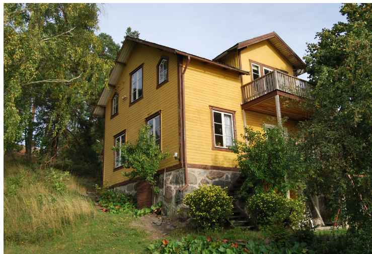
Villorna i ursprunglig skick är viktiga för att bevara Norra Lagnös karaktär. (17. se karta)