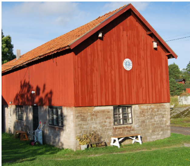
För att bevara äldre ekonomibyggnader kan en ny användning vara en lösning. Café i en av ladugårdslängorna i Löka by

Äldre ekonomibyggnader är viktiga inslag i landskapsbilden och för att bevara den äldre bykaraktären. Ny användning av äldre ekonomibyggnader s.k. överloppsbyggnader kan vara möjlig, men en ombyggnad ska ske med hänsyn till byggnads karaktär och uttryck.