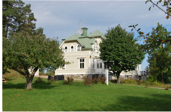
Mot slutet av 1800-talet blir byggnadskroppen mer oregelbunden och får ett brantare takfall, ofta med valde gavelspetsar. Villa Hildegård. Norra Lagnö 1:390 (14. se karta)