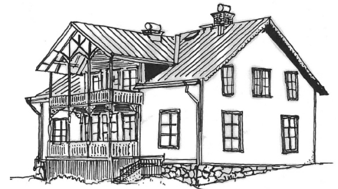
En helhetsbild av karaktärsskapande detaljer

Anpassa tillbyggnad efter tomtens topografi. Undvik sprängning eller markutfyllnader. Tillbyggnader får inte dominera över befintlig byggnad. Acceptera begränsningar och förutsättningar. Anpassa tillbyggnadsmaterial, fönsterproportioner och färger till befintlig byggnad. Det nya behöver inte se gammalt ut, men bör samverka till en helhet med befintlig byggnad.