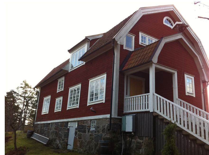
Kring 1910 får byggnaderna en mer sammanhållen byggnadskropp med stora takfall, småspröjsade fönster och enkla dekorationer. Villa på Storängsholmen. Norra Lagnö 1:86 (15. se karta)