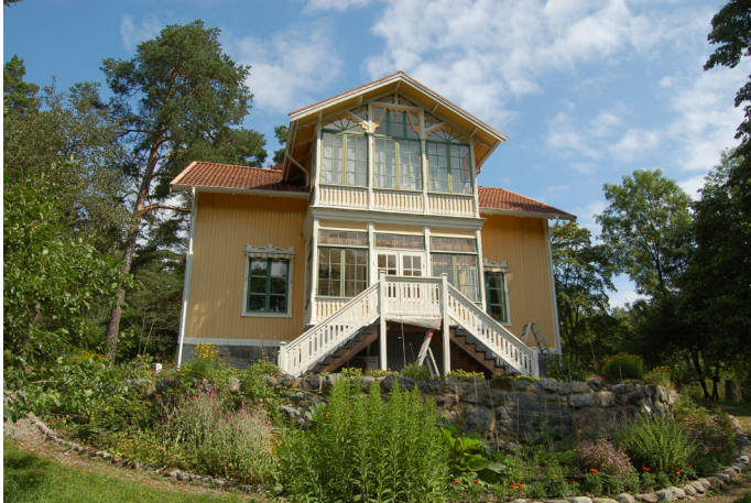
Villa Skogstorp, utefter Toivovägen med fasaden mot Långsundaviken. En av Norra Lagnös mest ursprungliga och karaktäristiska villor från 1880-tal. Norra Lagnö 1:25 (5. se karta)