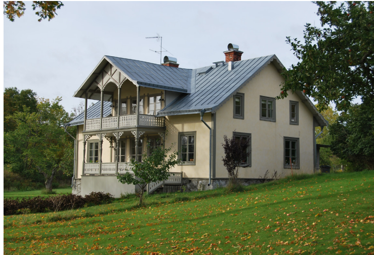
Norra Lagnö gårds mangårdsbyggnad har renoverats och bevarat sin ursprungliga karaktär. (16. se karta)

Miljön kring Norra Lagnö gård har höga kulturhistoriska värden tack vare den välbevarade bebyggelsemiljön som speglar Norra Lagnös äldre historia. Mangårdsbyggnaden, stora Skönvik, ladugårdslängan samt den bevarade bymiljön utmed Lagnö gårdsväg är alla viktiga delar i det som utgör det ursprungliga Norra Lagnö by.