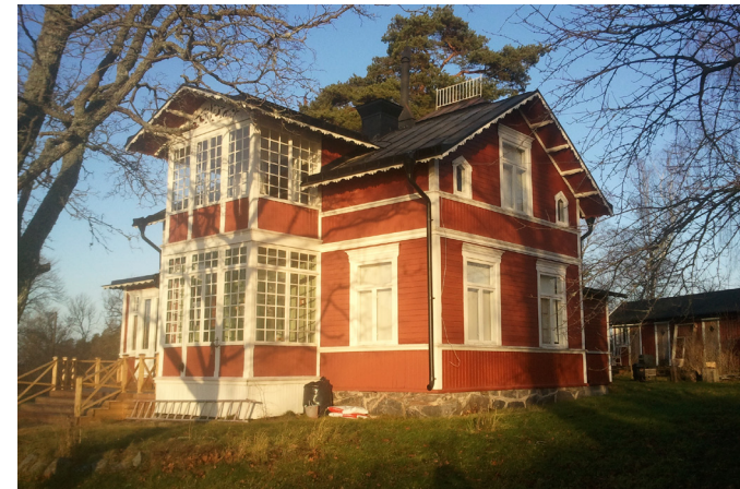
Välbevarad sommarvilla med karaktäristiska detaljer, exempelvis den småspröjsade inglasade verandan, Det flacka lätta sadeltaket bärs upp av taktassar och pryds av en dekorativ takfot. Norra Lagnö 1:17 (11. se karta)