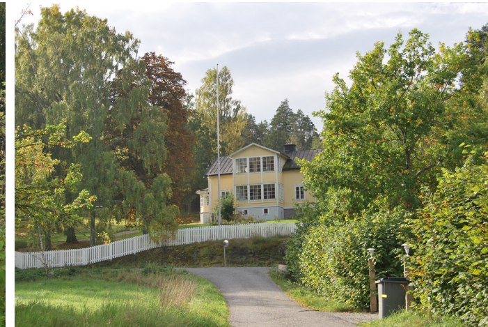
Alphyddan vid Karlsruhevägen, byggd under 1880-talets första hälft. Till villan hörden en kägelbana. Norra Lagnö 1:24. (2. se karta)