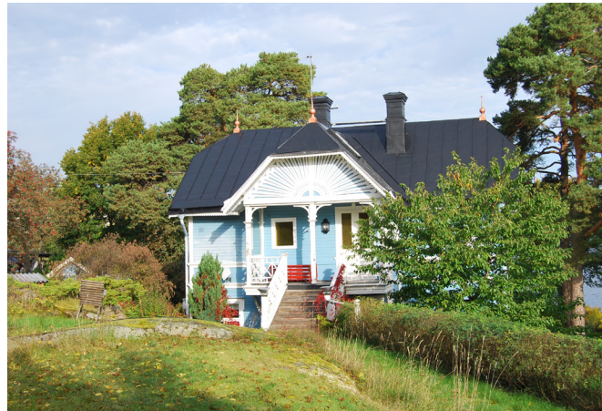
Klippan invid Dansbaneberget. Norra Lagnö 1:62 (8. se karta)

I sommarvillorna kunde ägaren ge uttryck för sin personlighet och smak varför villorna kan visa upp olika typer av stildrag. Rådande stilar för olika tidsperioder kan dock urskiljas. Tidigast och även på Norra Lagnö, dominerar schweizerstilen med sin lövsågeriarkitektur efter bl.a. Charles E Löfvenskiöld och Adolf W Edelsvärds mönsterböcker. Byggnadsformen är symmetrisk, försedd med frontespis, med underliggande öppen eller inglasad veranda med småspröjsade glas och med infällda rombiska färgade rutor. Det flacka plåtbelagda sadeltaket skjuter långt ut från fasaden och bärs upp av taktassar.