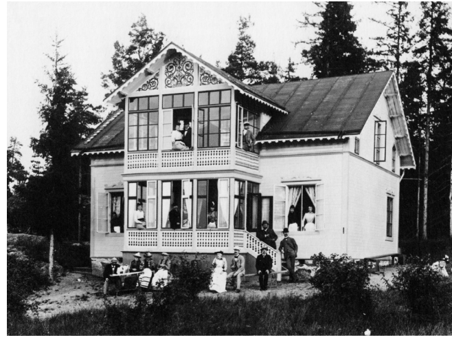
Erikslund, uppfört 1884. Numera rivet. Norra Lagnö 1:80.

Därefter uppförs villor utmed Lagnövägen på höjden ovan Lagnö brygga samt i slutningen mot Lagnö gårds åkermarker och mot Långsundaviken. Här uppförs villorna Skogshyddan, Klaraberg, Carlberg och Lugnet, mellan åren 1884 och 1887. Ovanför Lugnet mitt uppe på berget byggs slutligen Tallbacken 1887 med milsvidd utsikt över Torsbyfjärden.