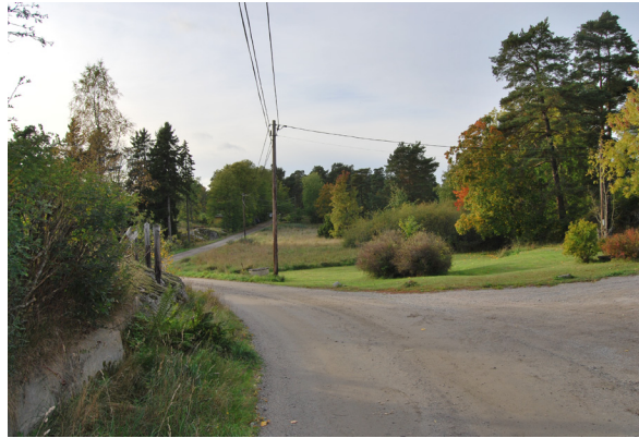
Grusvägarna på Norra Lagnö bidrar är viktiga för områdets karaktär.

Lagnö gård, från vilken villa- och fritidstomter har avstyckats, finns ännu kvar inne vid Lagnöviken. Boiningshus och ekonomibyggnader är huvudsakligen från slutet av 1800-talet. Norra Lagnö gårdsbyggnad, reveterad i grå puts har vid inventeringstillfället renoverats förtjänstfullt. Lagnö byväg har kvar sin ursprungliga sträckning med bostadshus tätt placerade efter den gamla vägen, vilket bidrar till att bykaraktären från omkring sekelskiftet 1900 lever kvar. De öppna markerna som idag hävdas av bete är avgörande för upplevelsen av det ursprungliga norra Lagnö gård.