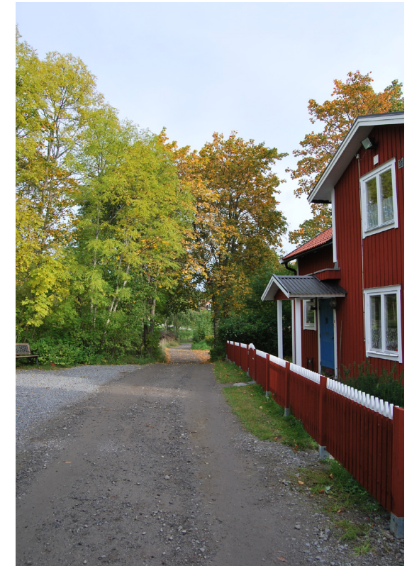
Norra Lagnö byväg har i stort samma sträckning som under 1700-talet