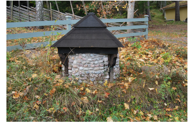
En vackert utformad brunn utefter Karlruhevägen.