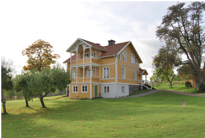
Villorna vid Panama och Stora Skönvik vid Lagnö gård är karaktäristiska exempel på de tidiga sommarvillorna i Schweizerstil med lövsågeridelajer över den öppna verandan. Panama 3:2, Norra Lagnö 1:296 (12, 13. se karta)

Mot 1800-talets slut bryts den regelbundna planen upp i en oregelbunden form med utskjutande torn, burspråk och utkragad övervåning. Fasadens många vinklar ger en livfull fasad med mycket ljus och skugga. Det tunna plåttaket blir brantare och pryds med torn och flöjlar. De nya villorna hämtar förebilder från Tyskland, England och Amerika. Särskilt får den engelska cottage-stilen genomslag.