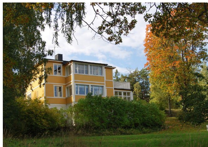
Den italienskipirerad villan Granliden är uppförd 1898. Norra Lagnö 1:308 (3. se karta)