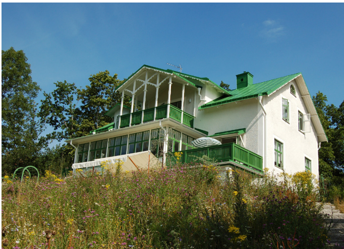
Eckbacken, utefter Toivovägen. Norra Lagnö 1:286. (7. se karta)