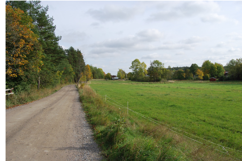
Det före detta odlingsmarken kring Norra Lagnö gård hålls fortfarande öppen, vilket är viktigt för att bevara karaktären kring Norra Lagnö by.

Värdefulla kulturmiljöer eller kulturlämningar i skogen ska tas hänsyn till enligt Skogsvårdslagen (1979:429) 30§. Några exempel på kulturlämningar i skogen är t.ex. kvarnar, sågar, husgrunder, odlingsrösen och stenmurar. Flera av dessa lämningar kan vara registrerade som övriga kulturhistoriska lämningar i Riksantikvarieämbetets fornminnesregister