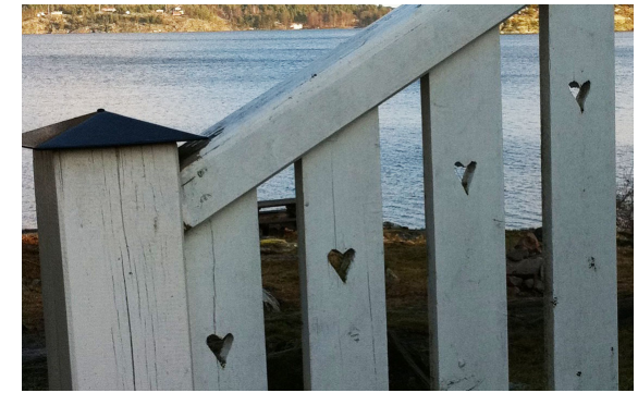
I de allmogeinspirerade villorna blir hjärtan blir vanliga dekorationer

Kring 1910 ersätter jugend- eller de nationalromantiska vilorna de svulstiga 1800-talsvillorna. Enkel lantliga hemtrevnad förespråkas och villorna hämtar inspiration från gamla svenska allmogehem. Fasaderna målas röda och knutarna är vita. Man vänder sig mot pråliga utsmyckningar och väljer enklare former. Hjärtan är ofta återkommande dekorationer på räcken och grindar.