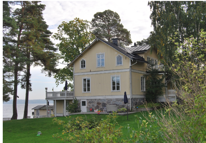
Alexandria , vid Lagnö brygga, en av Norra Lagnös första sommarvillor Lagnö 1:39 (1. se karta)

Villorna på nordvästra Lagnö uppfördes mellan 1882 och 1888. Tomterna intill Alphyddan, Villa Granliden och Hildegård bebyggdes något senare, 1898 respektive 1905.