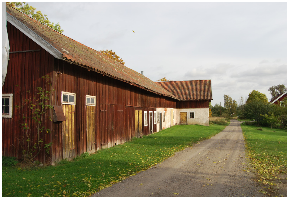
De öppna markerna och den bevarad ladugårdslänga vid Norra Lagnö gård är viktiga inslag som berättar om Norra Lagnös äldre historia.