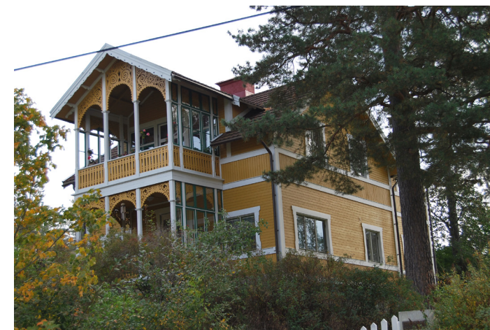
Skogshyddan vid Lagnövägen, byggd under 1880-talets mitt. Norra Lagnö 1:42. (4. se karta)