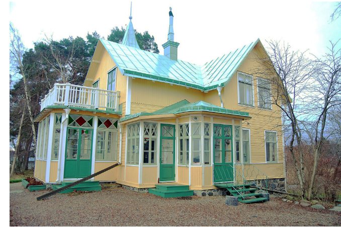
Sommarvillan på Myrholmen är Norra Lagnös mest praktfulla s.k. tornvillor. Villan är uppförd 1897. (9. se karta)