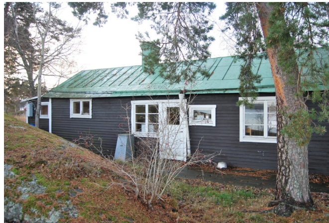
Från slutet av 1920- fram till 1960-talet har sportstugor och enklare fritidsbebyggelse byggts till på öarna. Norra Lagnö 1:355 (10. se karta)